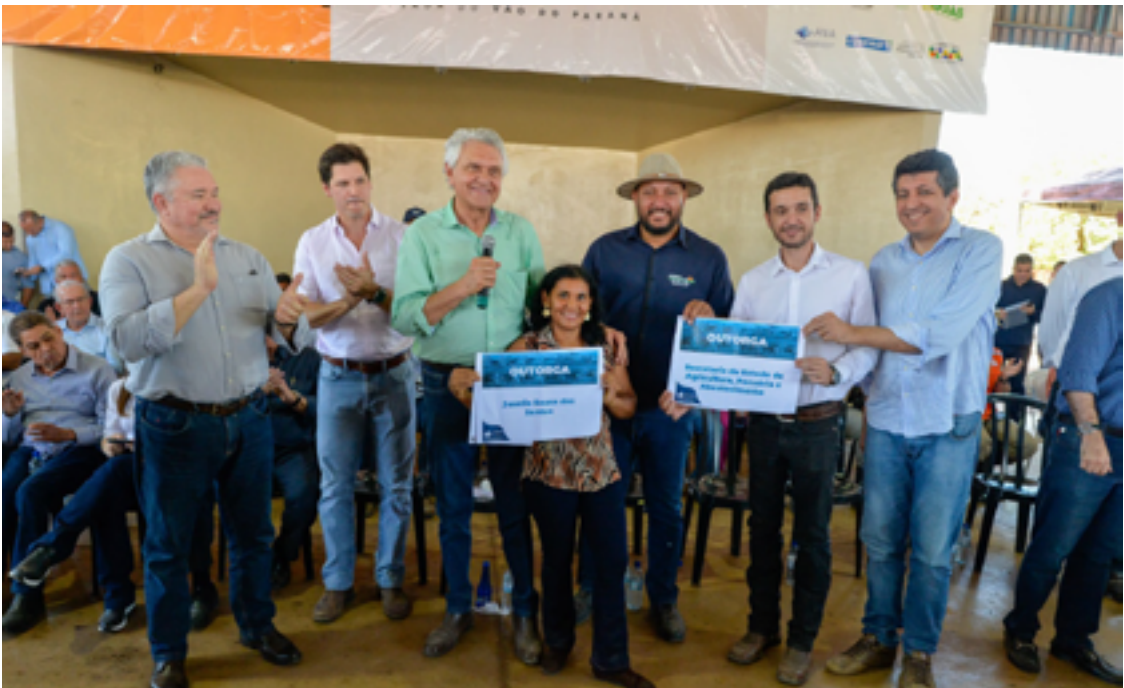
Governador Ronaldo Caiado, vice Daniel Vilela e gestores lançam projeto de fruticultura, em Flores de Goiás

Lançado na quarta-feira, 13, pelo governador Ronaldo Caiado, o projeto de Fruticultura Irrigada do Vão do Paranã, do Governo de Goiás, pode ser a solução de vida para diversas famílias que buscam na agricultura familiar um meio para o sustento. Segundo o Governo de Goiás, a estimativa é que cada família tenha receita bruta superior a R$ 210 mil por hectare. A expectativa é de que seja coberta área de 296 hectares. Conforme o Governo, o projeto atende 150 produtores da região Nordeste do estado. Tanto o governador Ronaldo Caiado quanto o vice-governador Daniel Vilela mostraram entusiasmo com o projeto. Para Caiado, o conhecimento estrangeiro auxiliará nas etapas de ampliação