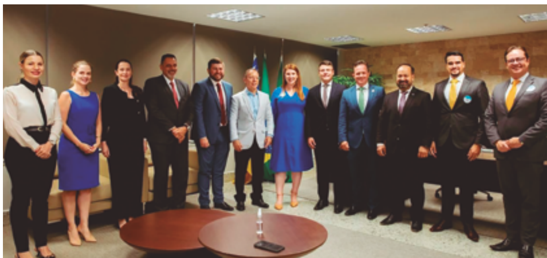
Esforço coletivo com autoridades, de diversas instituições e órgãos, em reunião na sede da Justiça em Goiânia

A ABA foi vice-campeã goiana em 2023. No domingo, 10, no ginásio Gracinda Maria, a equipe anapolina acabou derrotada por Mozarlândia pelo placar de 44 a 75 no jogo 2 da final do Goianão da modalidade. O time da cidade já havia perdido o primeiro duelo, no Norte do estado, e ficou com o vice na série melhor de três.