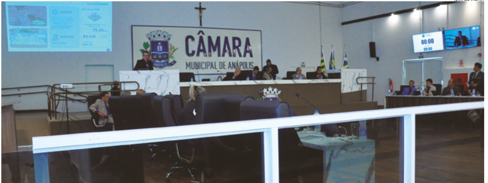
Sessão extraordinária será realizada no plenário Teotônio Vilela, com início previsto para as 10 horas; votação pode ser acompanhada ao vivo pelo canal da TV Câmara no Youtube