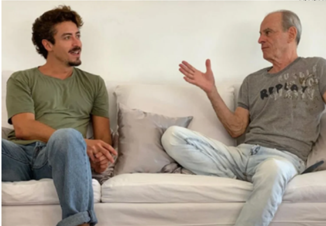
Jesuíta Barbosa e Ney Matogrosso conversam sobre 'Homem com H': filmagem em fevereiro

H á uma antiga querela entre melômanos. Põe em lados opostos os que gostam de cinebiografias e os que detestam a transposição biográfica à telona como experiência artística. Ân, experiência artística?! Bom, em primeiro lugar, faça-me o favor! E entenda de uma vez por todas o seguinte: vida é arte, arte é vida e um dificilmente existe sem o outro. Na cabeça dos fãs, não raro, o diretor tal eximiu fulano da narrativa ou, pior, aquele lá encaretou sicrano quando suprimira passagens cruéis dessa existência desvairada.