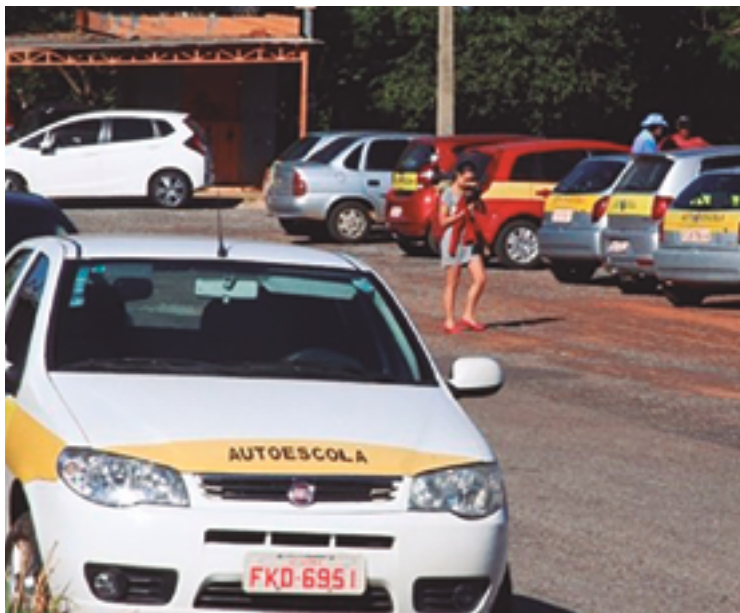
As bancas tiveram o número de vagas acrescido depois da pandemia