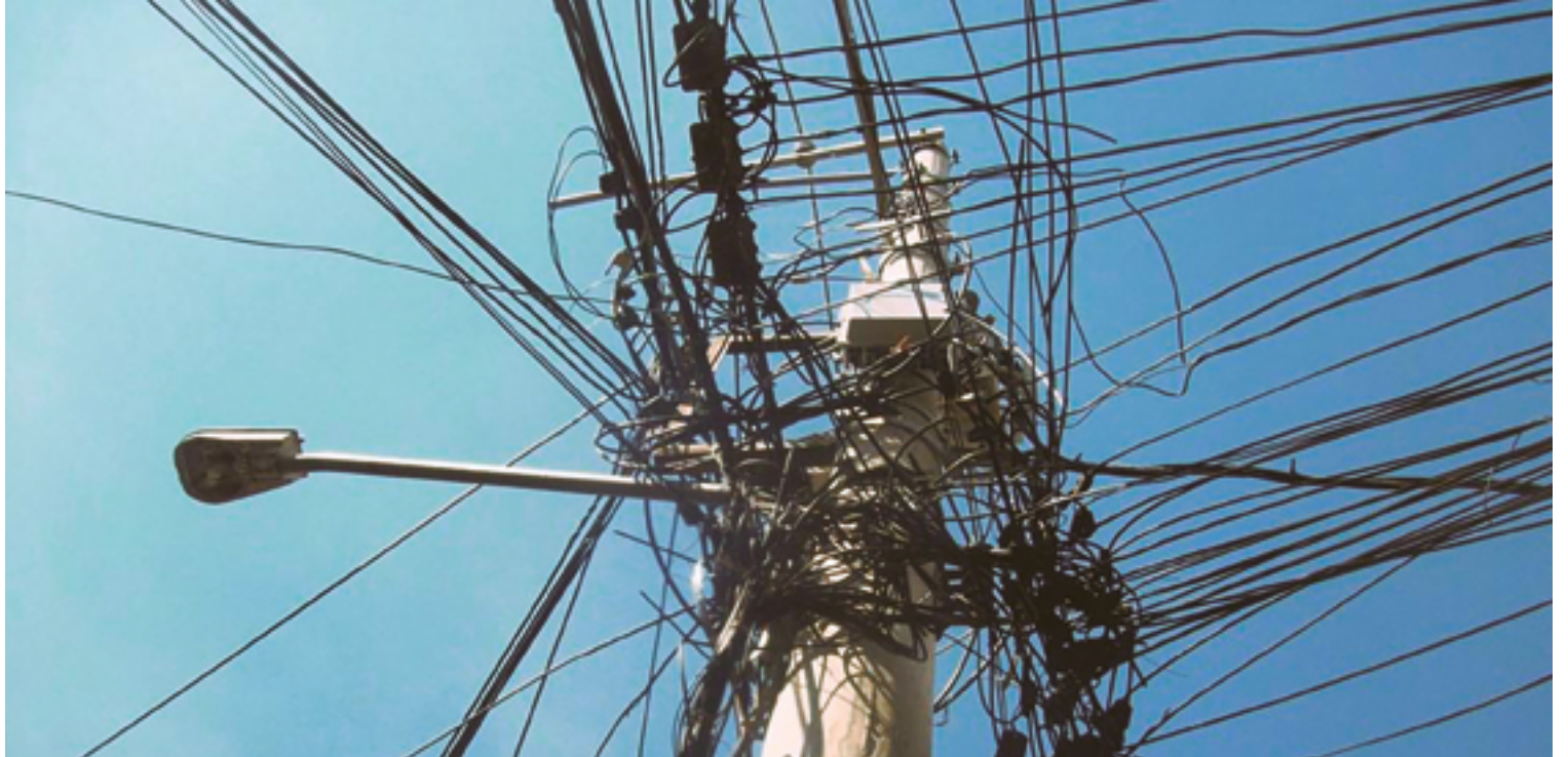
É consenso que, além da poluição visual, cabos soltos colocam em risco a vida de motociclistas e ciclistas; problema persiste e ainda sem solução