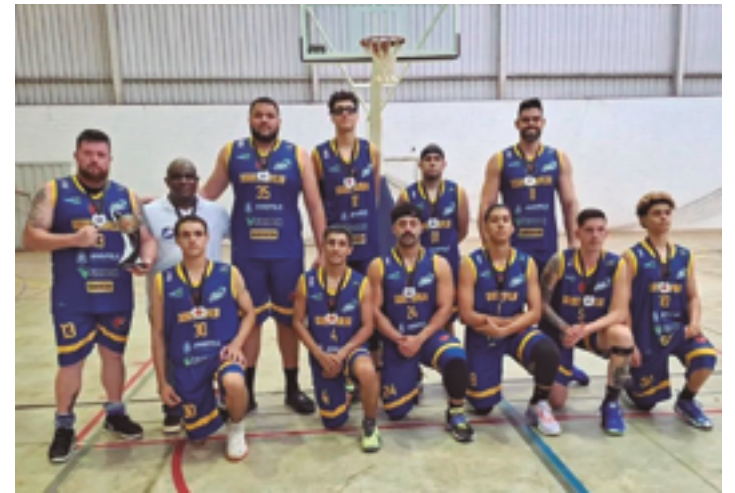
ABA mantém esperanças de se habilitar para o Brasileiro em 2025

O desembargador também elogiou a iniciativa da comitiva de Anápolis, que demonstrou união e articulação em prol de um objetivo comum, e disse que o TJGO está aberto ao diálogo e à parceria com os poderes públicos e a sociedade civil organizada. (Colaborou José Aurélio Mendes)