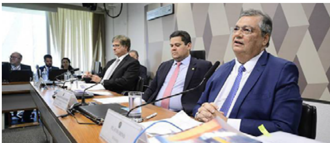
Paulo Gonet, Davi Alcolumbre e Flávio Dino: sabatina na CCJ do Senado: nomes aprovados

Durante sabatina no Senado, o ministro da Justiça, indicado para cadeira no Supremo Tribunal Federal, acenou a parlamentares. “Tenho a dimensão do Judiciário não deve criar leis”. Aprovados pelo plenário da CCJ, as indicações feitas pelo presidente Lula de Flávio Dino e a de Paulo Gonet para a Procuradoria Geral da República vão ao plenário do Legislativo